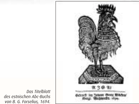
Das Titelblatt des estnischen Abc-Buchs von B. G. Forselius, 1694.