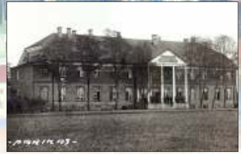
Estnische Alexanderschule in Pöltsamaa (Oberpahlen).

Das Poster wurde angefertigt vom Estnischen Literaturmuseum, vom Estnischen Ministerium für Bildung und Wissenschaft und von der Estnischen Gesellschaft für Muttersprache. Text: Jüri Viikberg. Layout: Margus Nõmm, Zentrum für Multimedia der Universität Tartu 2008.