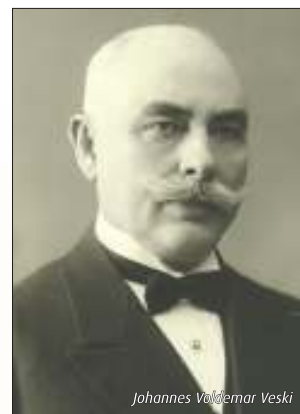
Johannes Voldemar Veski